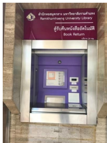
ภาพที่ 4 ตู้รับคืนหนังสืออัตโนมัติ (Book Return)