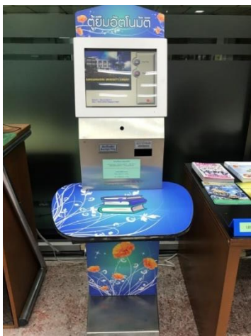
ภาพที่ 3 ตู้ยืมหนังสืออัตโนมัติ (Self Check)

1. ระบบตู้ยืม-คืนอัตโนมัติมีขนาดที่เหมาะสมสังเกตเห็นได้ง่าย และตัวเครื่องมีความทันสมัยเหมาะแก่การเข้าใช้บริการ