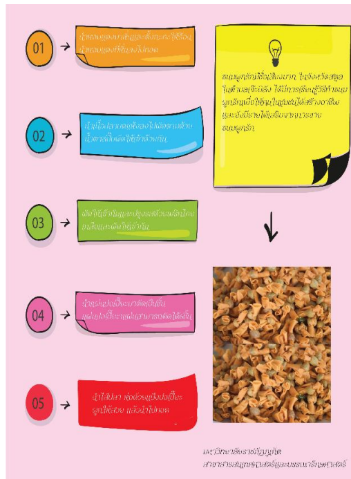
ภาพที่ 4 ขั้นตอนการทำขนมผู้รักในรูปแบบ Infographic