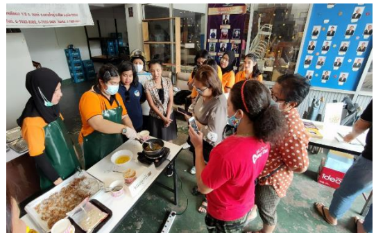
ภาพที่ 6 ขั้นตอนการทำและวิธีการทำขนมผู้รัก