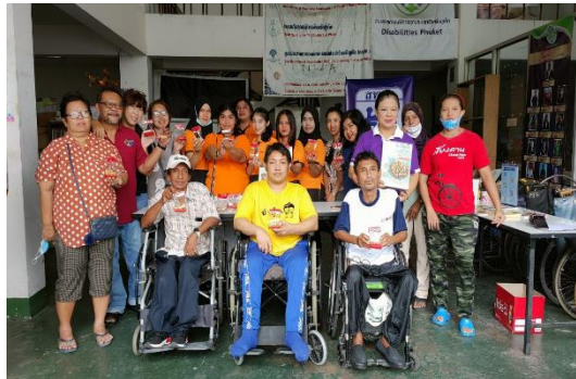
ภาพที่ 9 ถ่ายรูปร่วมกัน