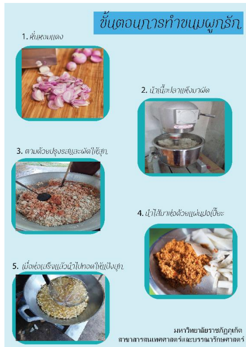
ภาพที่ 3 ขั้นตอนการทำขนมผูกรักในรูปแบบ Infographic