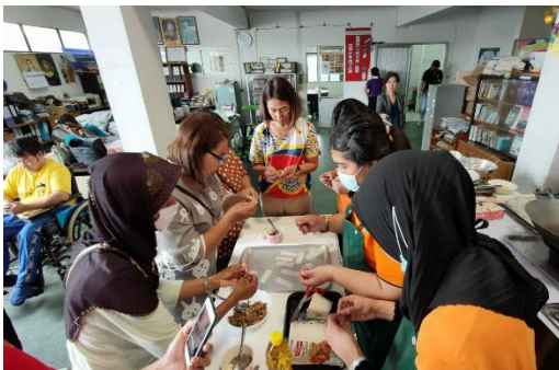
ภาพที่ 5 ขั้นตอนการทำไส้ปลา