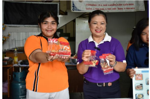
ภาพที่ 8 บรรจุภัณฑ์