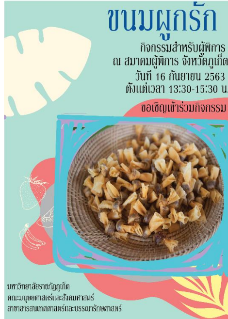
ภาพที่ 2 โปสเตอร์ประชาสัมพันธ์กิจกรรม