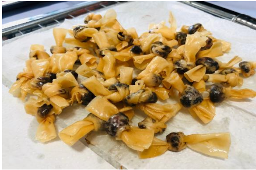
ภาพที่ 7 ขนมผู้กรัก