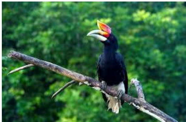
ภาพที่ 2 นกเงือกในเขตรักษาพันธุ์สัตว์ป่าฮาลา-บาลา อำเภอเวียง จังหวัดนราธิวาส

1.9 เขตรักษาพันธุ์สัตว์ป่าฮาลา-บาลา ได้รับการประกาศให้เป็นเขตรักษาพันธุ์สัตว์ป่าเดียวกัน คือป่าฮาลา ในเขตอำเภอเบตง จังหวัดยะลา และอำเภอจะแนะ จังหวัดนราธิวาส แต่ส่วนที่เปิดให้ประชาชนเข้าไปศึกษาธรรมชาติได้ จะเป็นป่าบาลาเท่านั้น ป่าบาลามีพื้นที่ครอบคลุม อำเภอเวียง และอำเภอสุคีริน จังหวัดนราธิวาส ตั้งอยู่ในหมู่ที่ 5 ตำบลโละจูด อำเภอเวียง จังหวัดนราธิวาส นอกจากความสมบูรณ์ของผืนป่าแล้ว ‘บาลา-ฮาลา’ ถือว่าเป็นจุดชมนกเงือกที่ยอดเยี่ยม เพราะนกเงือกจำนวน 10 ชนิดที่พบในไทย (ทั่วโลกมีนกเงือก 55 ชนิด) สามารถพบเห็นที่ ‘บาลา-ฮาลา’ ถึง 10 ชนิด แถมการชมนกเงือกในผืนป่าแห่งนี้ ไม่ต้องบุกป่าฝ่าดงแต่อย่างใด เพียงขับรถจอดแอบ ๆ ข้างทางลาดยาง แล้วนั่งเียบ ๆ ก็สามารถบันทึกภาพนกเงือกได้แล้ว